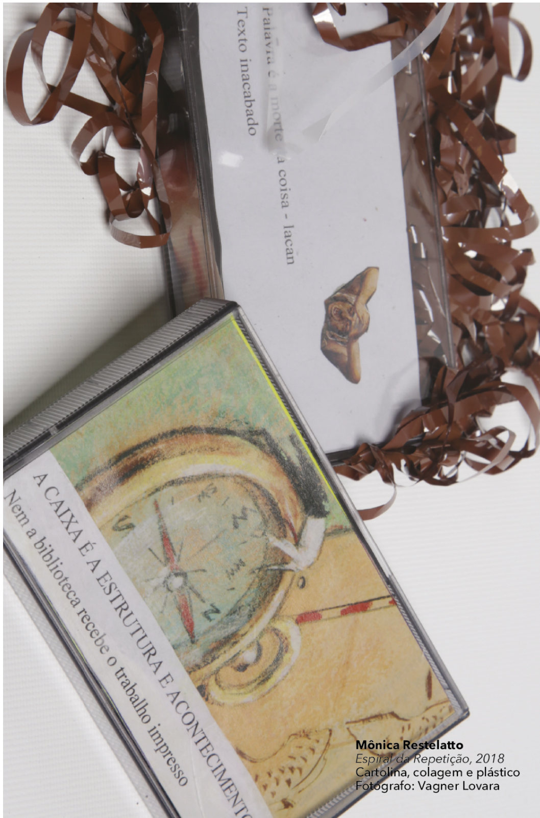
Mônica Restelatto Espiral da Repetição , 2018 Cartolina, colagem e plástico