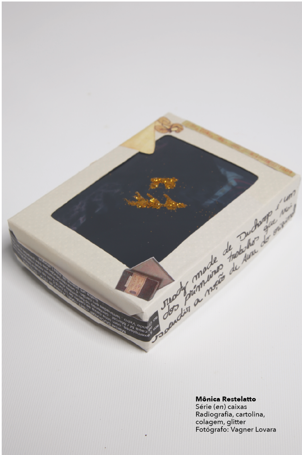
Mônica Restelatto Série (en) caixas Radiografia, cartolina, colagem, glitter