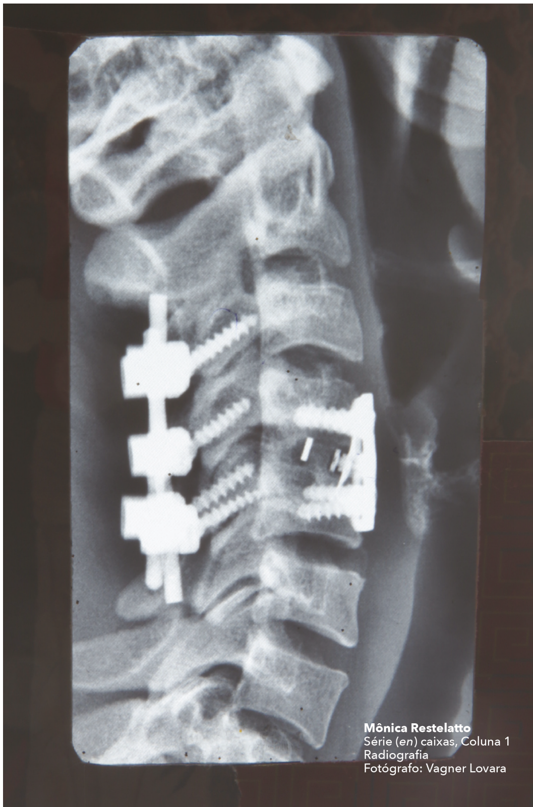
Mônica Restelatto Série (en) caixas, Coluna 1 Radiografia