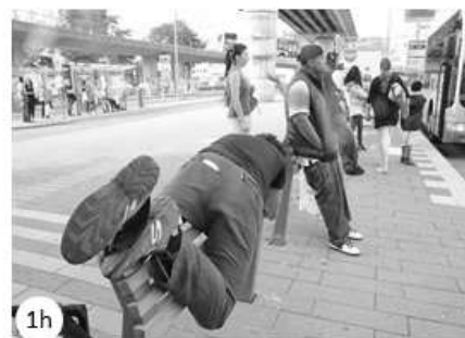
Figura 1: Bancos anti-mendigos