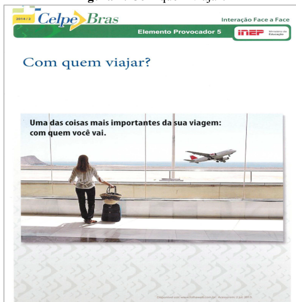
Figura 1: Com quem viajar?