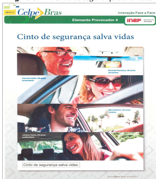
Figura 6: EP: Cinto de segurança salva vidas