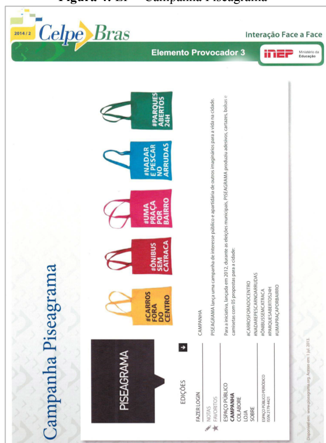
Figura 4: EP – Campanha Piseagrama 16

O EP 3 – Campanha Piseagrama foi utilizado apenas por um Avaliador-Interlocutor 5 (AI5) .